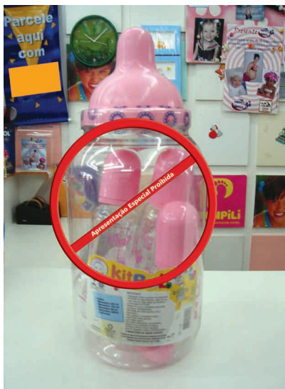
Figura 12. Exemplo de apresentação especial de bicos, chupetas e mamadeiras NÃO PERMITIDA pela NBCAL