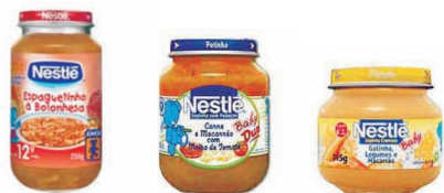
Figura 7. Exemplos de alimentos de transição para lactentes e crianças de 1ª infância, que são as papinhas, sopinhas, purês e suquinhos

✓ Alimento de transição para lactentes e crianças de primeira infância - qualquer alimento industrializado para uso direto ou empregado em preparado caseiro, utilizado como complemento do leite materno ou de fórmulas infantis, introduzido na alimentação de lactentes e crianças de primeira infância com o objetivo de promover uma adaptação progressiva aos alimentos comuns e propiciar uma alimentação balanceada e adequada às suas necessidades, respeitando-se sua maturidade fisiológica e seu desenvolvimento neuropsicomotor (LEI N.º. 11265/06).