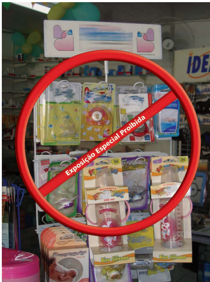
Figura 9. Exemplo de expositor apresentando “testeira”, considerado uma forma de exposição especial de bicos, mamadeiras e chupetas

Portanto, não é permitido fazer promoção comercial em qualquer meio de comunicação, incluindo merchandising, divulgação por meios eletrônicos, escritos, auditivos e visuais; estratégias de marketing para induzir vendas ao consumidor no varejo, tais como exposições especiais, cupons de descontos, preços abaixo dos custos, destaque de preço, prêmios, brindes, vendas vinculadas e apresentações especiais.