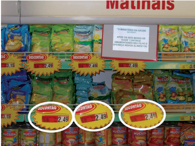
Figura 17. Como está sendo oferecido desconto nos produtos, com utilização de sinalizadores, a frase é obrigatória