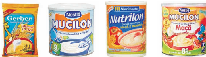
Figura 6. Exemplos de alimento à base de cereais para lactentes e crianças de 1ª infância, que são as farinhas instantâneas e preparos para mingau que possuem indicação no rótulo para crianças menores de 3 anos

√ Alimento à base de cereais para lactentes e crianças de primeira infância – qualquer alimento à base de cereais próprio para a alimentação de lactentes após o 6º (sexto) mês e de crianças de primeira infância, respeitando-se sua maturidade fisiológica e seu desenvolvimento neuropsicomotor (LEI N°. 11265/06).