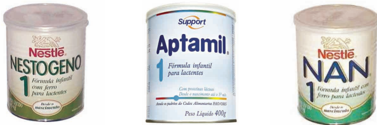
Figura 3. Exemplos de fórmulas infantis para lactentes

√ Fórmula infantil para lactentes – é o produto em forma líquida ou em pó destinado à alimentação de lactentes até o 6º (sexto) mês, sob prescrição, em substituição total ou parcial do leite materno ou humano, para satisfação das necessidades nutricionais desse grupo etário (LEI Nº. 11 265/06).