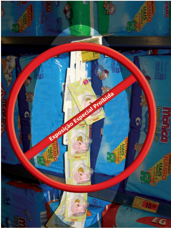
Figura 10. Exemplo de exposição especial que coloca chupetas em local de destaque junto a produtos infantis de diferentes finalidades