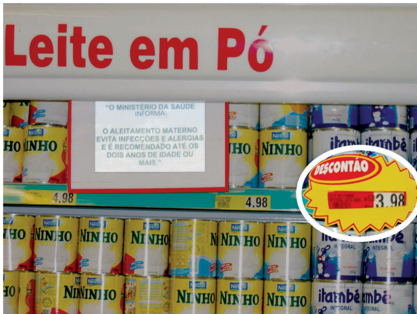
Figura 16. Como está sendo oferecido desconto no produto, com utilização de sinalizador, a frase é obrigatória

Para os alimentos de transição para lactentes e crianças de primeira infância, alimentos à base de cereais indicados para lactentes e crianças de primeira infância e outros alimentos e bebidas à base de leite ou não que forem apresentados como apropriados para crianças menores de 3 anos deve ser incluída, obrigatoriamente, a seguinte frase, visual e/ou auditiva, de acordo com o meio de divulgação: