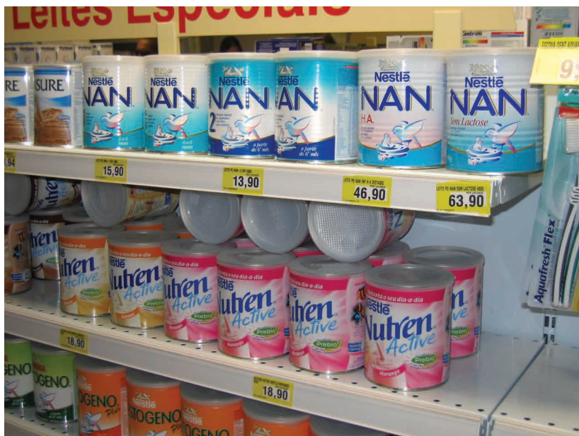
Figura 1. Exemplo de exposição tradicional de fórmulas infantis em gôndola, neste caso não há irregularidades, pois não há realização de promoção comercial