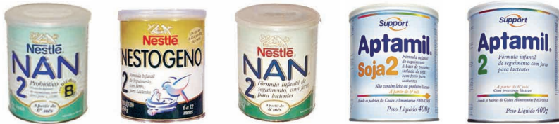
Figura 5. Exemplos de fórmulas infantis para o seguimento de lactentes

√ Fórmula infantil de seguimento para lactentes – produto em forma líquida ou em pó utilizado, por indicação de profissional qualificado, como substituto do leite materno ou humano, a partir do 6º (sexto) mês (LEI N°. 11265/06).