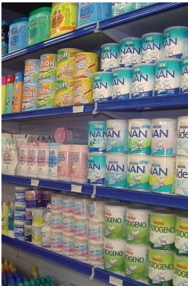
Figura 2. Exemplo de exposição tradicional de fórmulas infantis em gôndola neste caso não há irregularidades, pois não há realização de promoção comercial