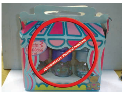
Figura 13. Exemplo de apresentação especial de mamadeiras