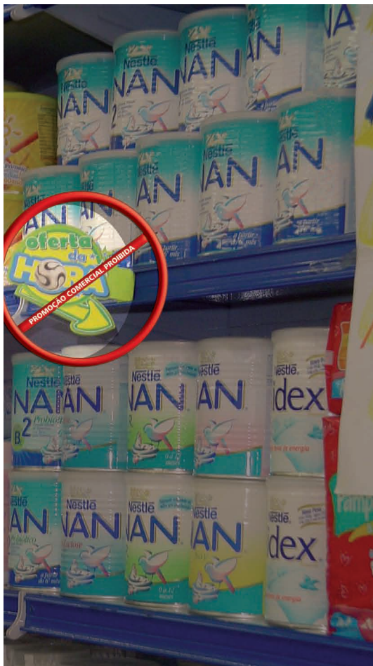
Figura 11. Utilização de sinalizador interno para promover comercialmente fórmula infantil

A NBCAL veda a utilização de embalagens de fantasia, como exemplificado nas Figuras 12 e 13, ou embalagens que agreguem produtos de diferentes finalidades como mostrado na Figura 12.