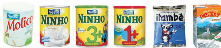
Figura 8. Exemplos de leites, em geral, que podem ser leite de vaca ou cabra integral, semi-desnatado, desnatado, e alimento a base de soja, acondicionados em embalagens do tipo longa vida, sacos e latas

√ Mamadeira - objeto utilizado para alimentação líquida de crianças, constituído de bico e recipiente que armazena o alimento, podendo ter anel retentor, para manter acoplado ao bico e ao recipiente, conforme definido na norma técnica brasileira NBR 13793: Segurança de Mamadeiras.