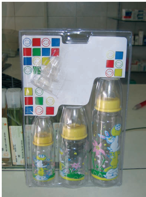
Figura 14. Exemplo de conjunto de mamadeiras DE ACORDO com a NBCAL

A comercialização de conjuntos de mamadeiras de tamanhos e formatos diferentes em uma mesma embalagem, como mostrado na Figura 14, não é vedada pela NBCAL, desde que cumpra os demais requisitos constantes na norma.